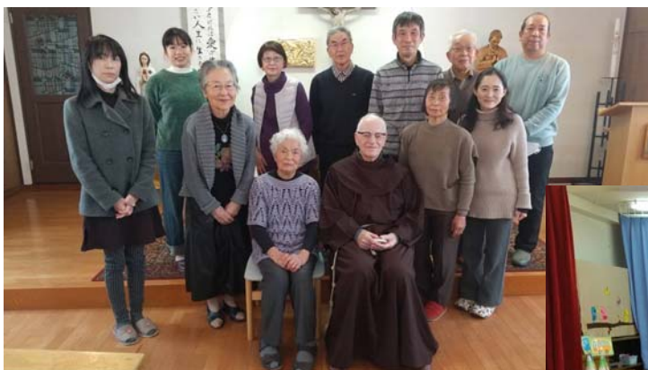
11月日教会の黙想会

We are the ones who shoot arrows of light into the darkness. 闇に光の矢を放つのは私たちである。